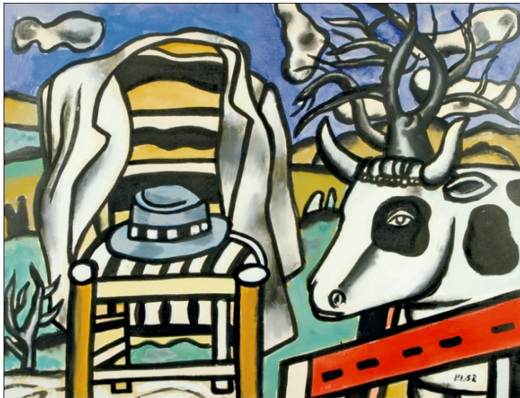
Fernand Léger, Chaise, chapeau et vache dans un paysage

L'exploitation agricole s'est métamorphosée à maintes reprises pour s'adapter aux évolutions structurelles et conjoncturelles. La révision successive de ses frontières a donné lieu à plusieurs formes d'exploitations. Ainsi on a assisté à l'émergence au fil du temps de différentes dénominations qui qualifient ces formes : système exploitation-famille, exploitation rurale, exploitation rurale, exploitation territoriale, exploitation durable. Cette diversité de formes reflète le potentiel intégrateur du modèle de l'exploitation agricole familiale qui permet de rendre compte de la pluralité des agricultures.