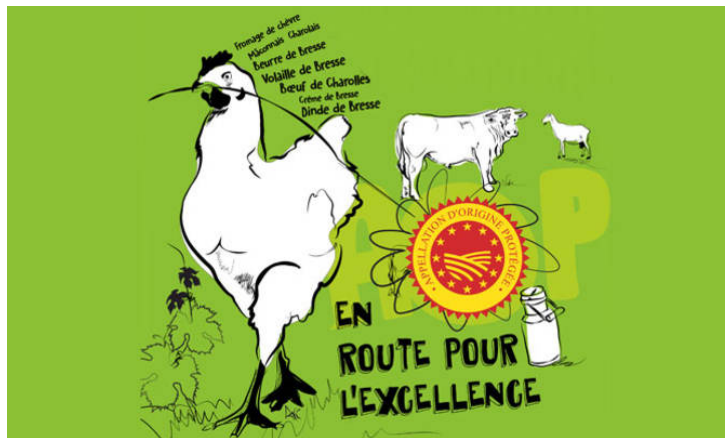
Dessin illustration AOP

production de ressources spécifiques au territoire ». Ce processus donne lieu à des interdépendances multiples entre l'exploitation en tant qu'organisation et son environnement local (naturel, social et économique). Dans la même perspective d'autres travaux ont proposé la notion d'« exploitation agricole territoriale » (Vandenbroucke, 2013).