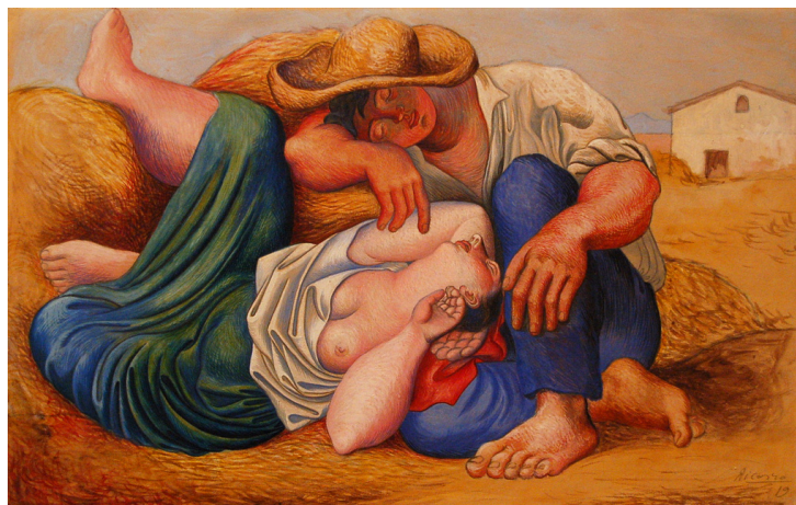
Paysans endormis, Pablo Picasso, 1919

A la sortie de la Seconde guerre mondiale, la démarche volontariste de modernisation de l'agriculture a fortement bousculé un paysage agricole marqué par une agriculture traditionnelle. Elle s'est notamment traduite par l'application de nouvelles méthodes de production basées sur les progrès techniques et la mécanisation et par l'intégration des exploitations au marché. L'exploitation agricole familiale modernisée a alors succédé à la petite exploitation traditionnelle, peu insérée au marché, qualifiée de « paysanne ». L'organisation de cette dernière a été finement étudiée par l'économiste russe Alexander Chayanov , dont les travaux font référence en la matière.