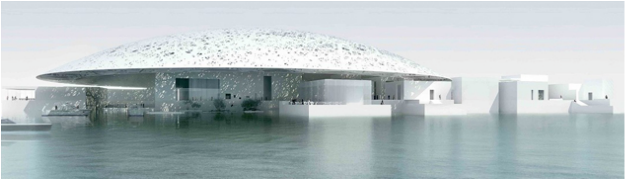
Louvre d'Abou Dabi

La création du musée universel du Louvre d'Abou Dabi (LAD) s'inscrit dans le droit fil de ces préconisations. Elle constitue en fait la première expérience à grande échelle de la valorisation internationale d'une marque muséale. En concédant son nom et sa notoriété pour une durée de trente ans, le musée du Louvre bénéficie d'une part, d'importantes retombées financières (un milliard d'euros) et, d'autre part, exporte son expertise culturelle adossée aux valeurs de l'institution.